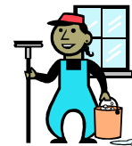
Limpiar la casa